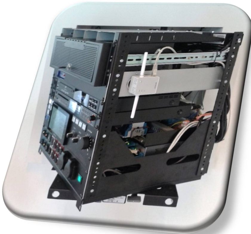
Konstruktive Umsetzung des Rackaufbaus durch den Auftragnehmer

Die Bedienelemente und die Klangregelung der PRO-Sektion sind mit einer abschließbaren Klappe gegen unbefugte Nutzung gesichert. Hier stehen zusätzliche Mikrofon- und Line Wege sowie erweiterte Zugriffsrechte für geschützte Inhalte im Netzwerkplayer zur Verfügung. Für die Nutzung in allen Sälen wurde ein gemeinsamer Bibliotheksserver im Tonstudio installiert, dessen Inhalte über die Netzwerkplayer wiedergegeben werden können.